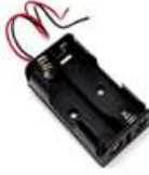
İkili pil yuvası